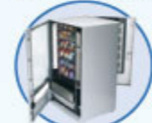
Particolare della doppia apertura