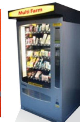
PV per esterno