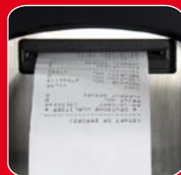
Stampante di ricevuta & statistiche di vendita

Multi Farm ha un'ampia gamma di optional che permettono di personalizzare il distributore automatico.